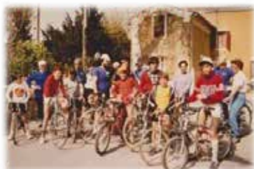
Une pause à ST-DIDIER pour les jeunes ou les encadrants ?

Il est dit aussi que les grands clubs ne meurent jamais. Après une décennie un peu délicate, le Club Vélocio va savoir rebondir et repartir à toutes pédales.