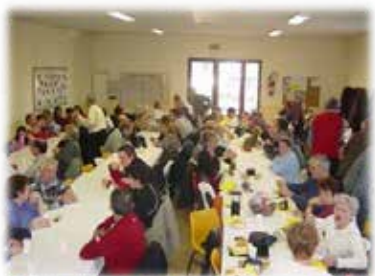
Loto et galette des rois

Les années se suivent et se ressemblent pour le club. En février le loto ; en avril le Rallye Cyclo de la ST-MARC ; en mai la randonnée VTT des Bories et le tournoi inter-associations ; en juin la journée champêtre avec les membres de la route, du VTT et ceux de l'école VTT ; en septembre la randonnée concentration cyclo des VALAYANS ; en décembre le téléthon.