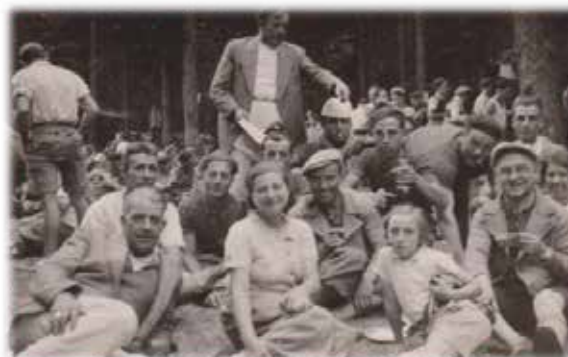
Un groupe de PERNOIS enjoués