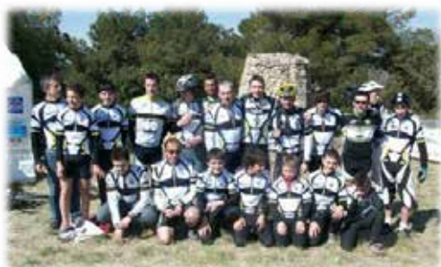
Finale du trophée à VENASQUE en 2007

2005. L'année est marquée par la double affiliation du club à la FFCT mais aussi à l'Union Française des Œuvres Laïques d'Education Physique. La dynamique VTT UFOLEP voit l'apparition d'un Trophée départemental qui regroupe 5 à 6 manches suivant les années. Les jeunes et adultes vétérinaires du club y participeront avec réussite suivant les catégories.