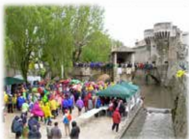
Pâques en Provence 2003