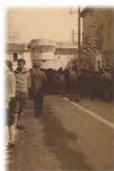
Avenue Paul de VIVIE