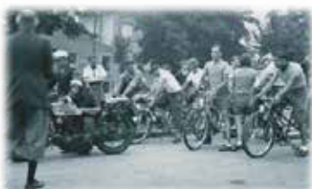
C'est la mode du tandem mixte

1936 : Le Front Populaire instaure les deux semaines de congés payés annuels. Des millions d'ouvriers et d'employés vont connaître leurs premières vacances. Pour cela beaucoup s'équipent de vélos et surtout de tandems pour partir en couple. Le peuple découvre la France grâce au cyclo-camping et s'empare d'une liberté toute neuve, celle du repos et du voyage pour le plaisir.