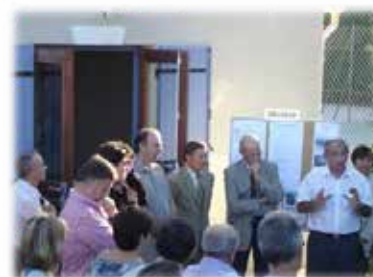
Inauguration du local en 2005

Les années se suivent et se ressemblent pour le club. En février le loto ; en avril le Rallye Cyclo de la ST-MARC ; en mai la randonnée VTT des Bories et le tournoi inter-associations ; en juin la journée champêtre avec les membres de la route, du VTT et ceux de l'école VTT ; en septembre la randonnée concentration cyclo des VALAYANS ; en décembre le téléthon.