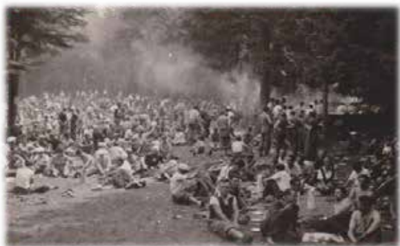
La Journée VELOCIO à ST-ETIENNE

Depuis 1922 est organisée au mois de juin à ST-ETIENNE, la Journée VELOCIO en l'honneur de Paul de VIVIE. Ce rassemblement cycliste se tient au col du Grand Bois et consiste en son ascension par catégories d'âge sans que ce soit cependant une course cycliste. Il a pour but de mettre en valeur les idées que prône VELOCIO pour la pratique du cyclisme de loisir. Cette organisation va connaître un engouement considérable. Tout bon cyclo se doit de participer à cette journée. Les pernois sont de ceux- là.