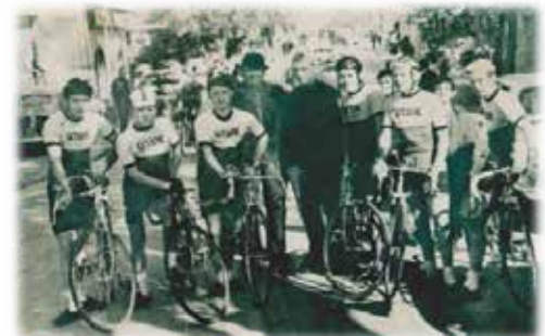
L'équipe de cadets en 1965