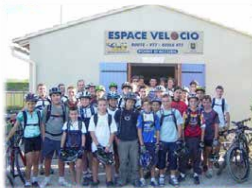
Les jeunes de l'école devant le local du club