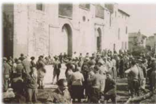
La manifestation se poursuit sur la place de l'église