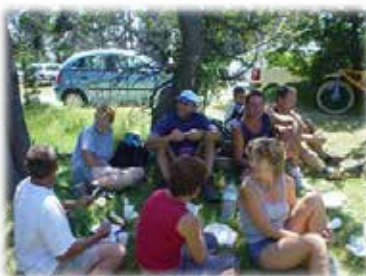
Journée champêtre au VENTOUX