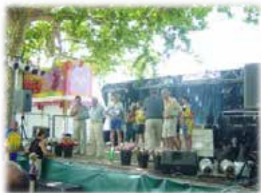
Remise des prix aux VALAYANS