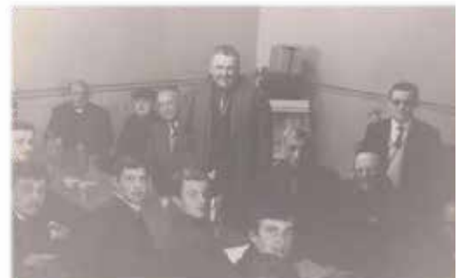
Une assemblée générale du club