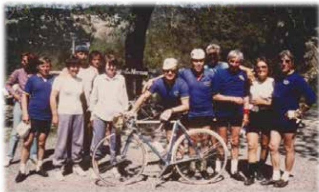
Le club en randonnée au Pont de MONTVERT

Cet arrêt brutal que tout le monde redoutait mais que l'on espère provisoire, va cependant influencer sur le nombre d'adhérents qui s'amenuise sans pouvoir déterminer si l'insécurité sur les routes et un éventuel déclin de l'engouement pour la petite reine en sont les causes.