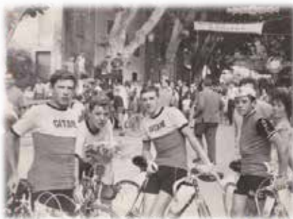
Grand Prix de PERNES

Parmi ces jeunes, une belle équipe de cadets se distingue dans toutes les courses, par sa cohésion et ses individualités.