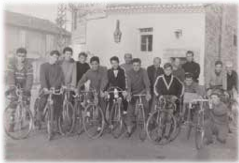
Rendez-vous pour une sortie hivernale