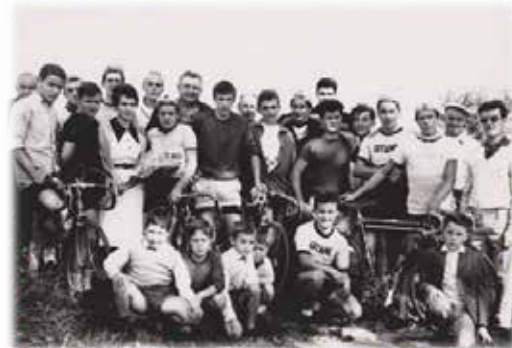
L'arrivée d'un contre la montre

Parmi ces jeunes, une belle équipe de cadets se distingue dans toutes les courses, par sa cohésion et ses individualités.