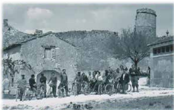
Le club devant le Château de VENASQUE

En août 1939 c'est la mobilisation générale. Les manufactures de cycles adaptent leurs productions aux circonstances et répondent prioritairement aux besoins d'armement (MFAC, RAVAT, etc...). La production de bicyclettes baisse et les pièces détachées manquent. Les pneumatiques sont introuvables sans un bon de la mairie. Mais les trois années qui suivront l'armistice de 1940 seront plus favorables au vélo avec la raréfaction des véhicules à moteur due à la pénurie d'essence. La bicyclette devient la compagne de tous les instants de chacun dans ses déplacements, mais aussi pour la course ....au ravitaillement !