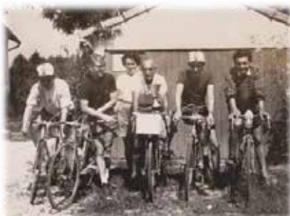
Semaine fédérale à DIGNE en 1965

Mais aussi d'excellents cyclos qui participent aux rassemblements régionaux, nationaux et avec succès aux Critériums Nationaux du Jeune Cyclotouriste.