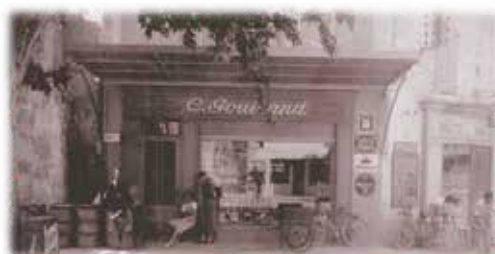
Le magasin de cycles de Charles GOUIRAND, situé à côté de la Chapelle des Abcès