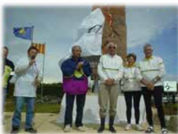
Inauguration du complexe en 2003