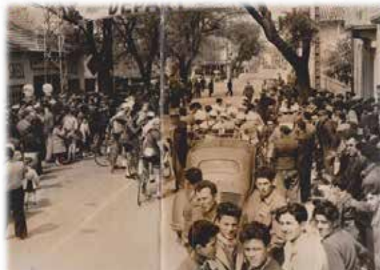
Départ de la course, route de CARPENTRAS, en face du garage LANTELME